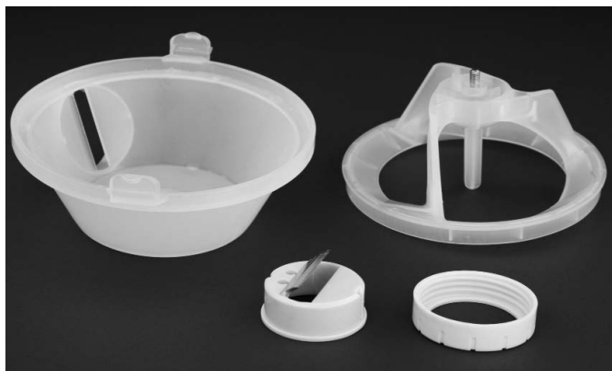
Cubierta de la cuchilla

Una vez que la cuchilla se haya desafilado, será necesario cambiarla. Es posible que también quiera apartar periódicamente la cámara de raspado de hielo para limpiar todas las piezas del interior.